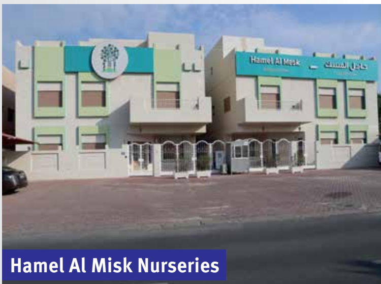
Hamel Al Misk Nurseries