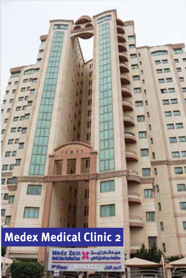
Medex Medical Clinic 2