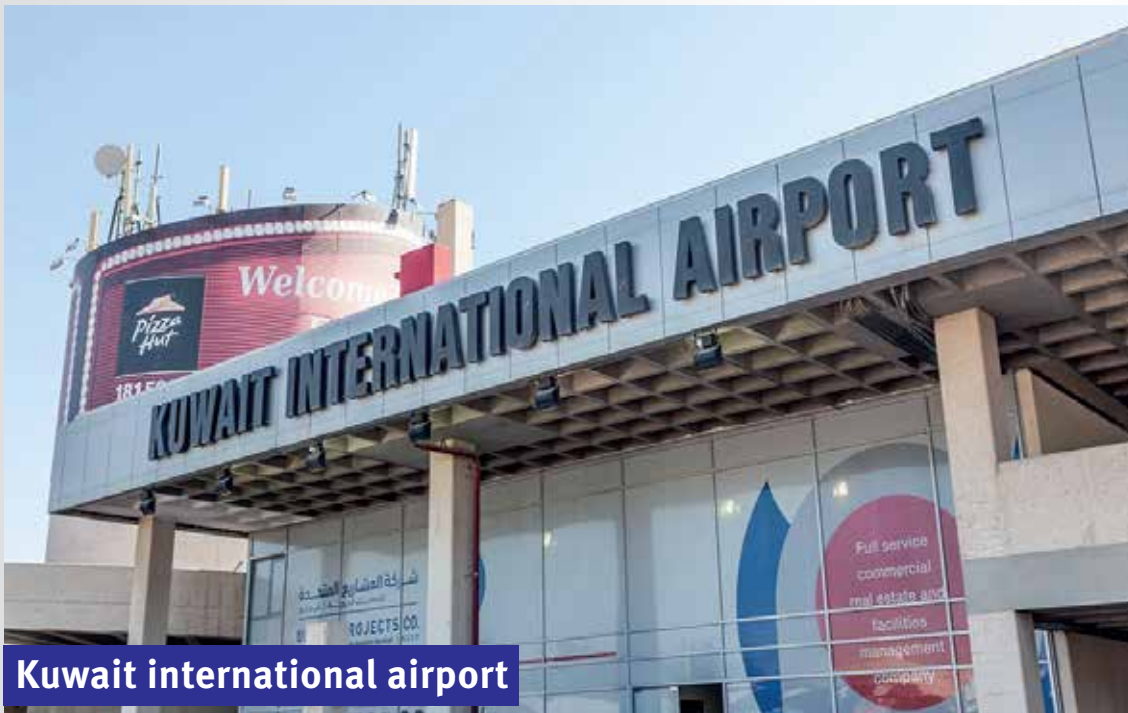
Kuwait international airport