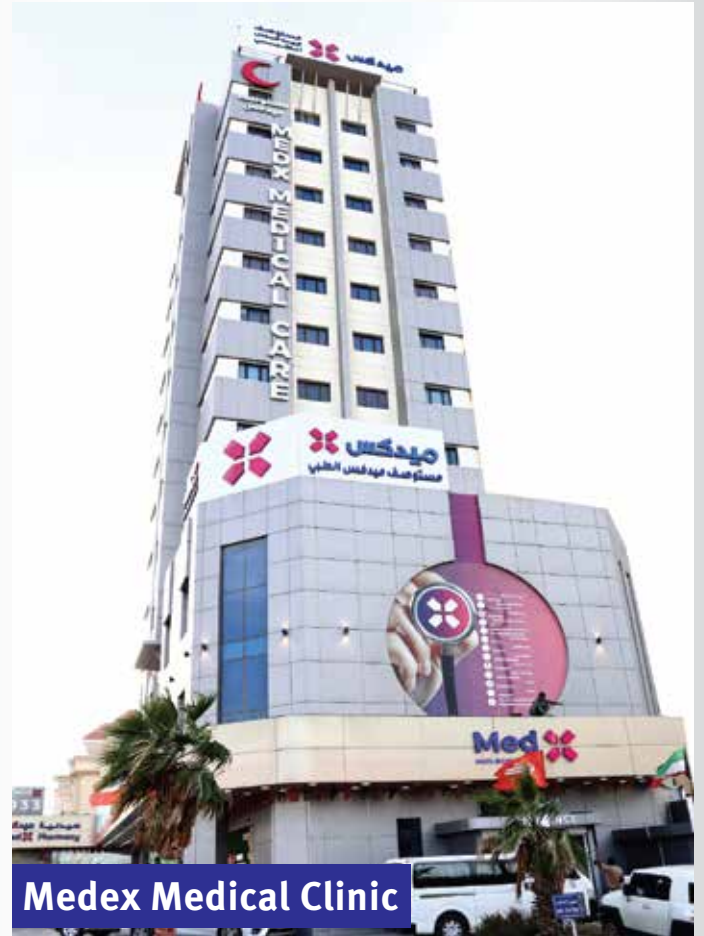
Medex Medical Clinic