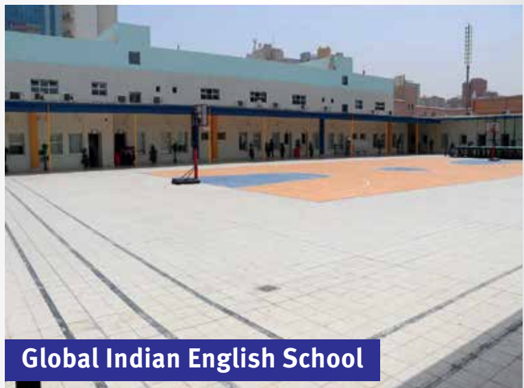
Global Indian English School