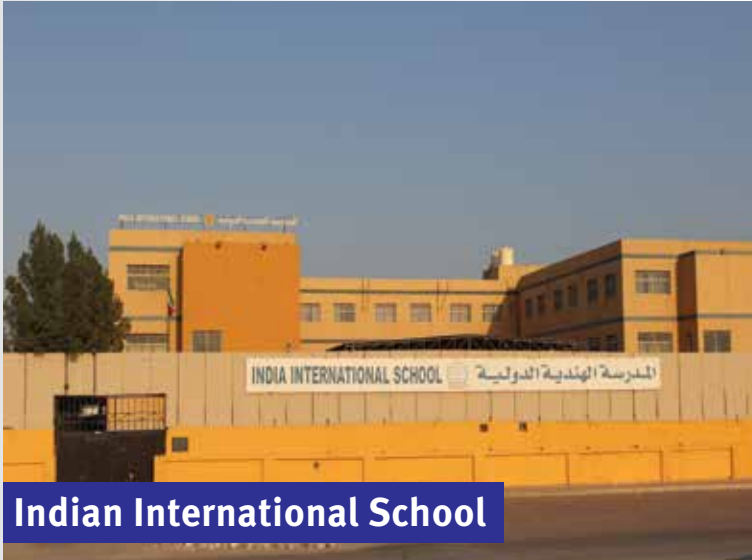
Indian International School